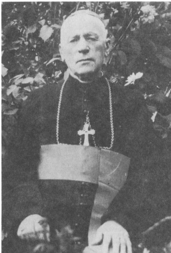
Archbishop Teofilus Matulionis, of Kaišiadorys, imprisoned for nearly a quarter-century during the Stalin era.

And miracle of miracles, under such conditions, a religious revival! The seed of the persecution of the nation during the post-War years and of the sufferings of the sons and daughters of the Church was not in vain; it is bearing fruit. The efforts of the atheists were in vain. It is impossible to rewrite history.