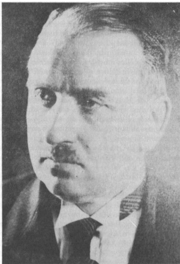
Professor Pranas Dovydaitis, deported in 1941 to Siberia where he later died. He was a signer of the Lithuanian Declaration of Independence in 1918, and a founder of the Lithuanian Catholic Youth movement, "Ateitis" ("Future").

of the world." ( History of the University of Vilnius, 1579 — 1803 . Introduction pp. 7,8)