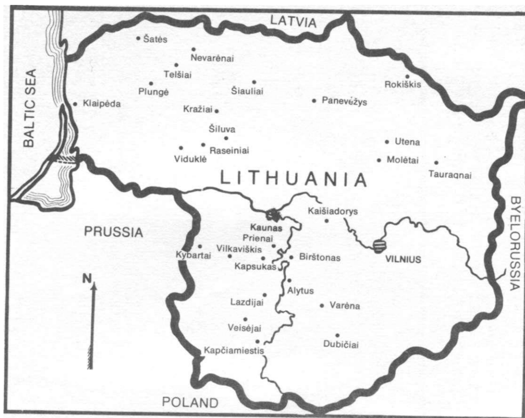
Places mentioned in the CHRONICLE OF THE CATHOLIC CHURCH IN LITHUANIA NO. 63