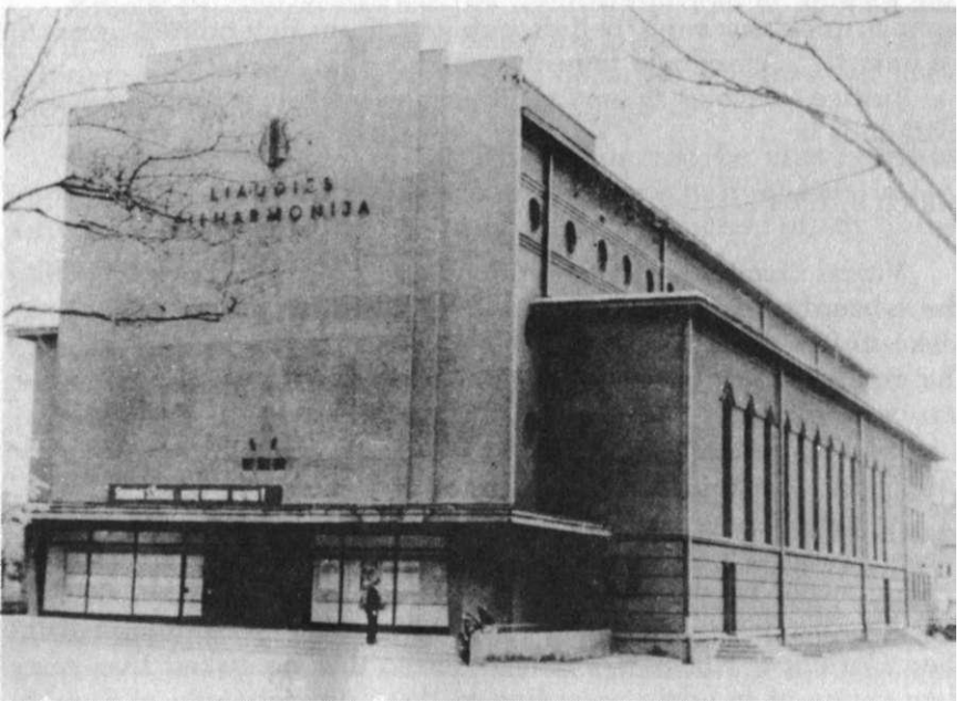
A 1976 photo of the Queen of Peace Church in Klaipeda, which was confiscated from the faithful in 1962 and converted into a concert hall.